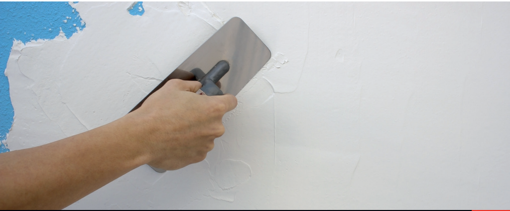
Enlucido de lleno con llana de tamaño medio sobre fondo de gotelé plastificado (pintura plástica tradicional)