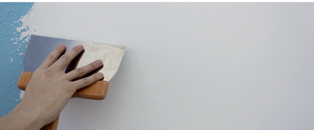
Enlucido de lleno con espátula ancha (20 – 22 cm) sobre fondo de gotelé plastificado (pintura plástica tradicional)