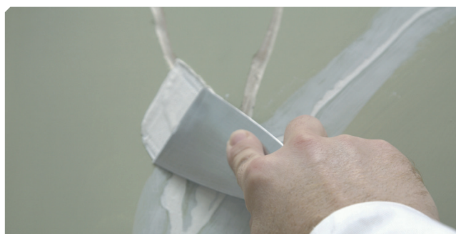
■ Fisuras superiores a 2 mm tratadas con masilla elástica